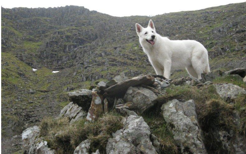
Ora houdt van uitzichtspunten.

Het is echt aanschuiven en bovendien mag Ora niet binnen, zodat we maar meteen terug aan de afdaling beginnen.