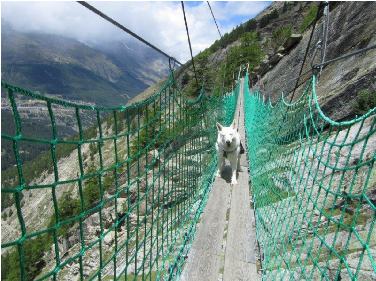
Ora op de hangbrug.

Nu komt de lange hangbrug. Het ziet er beter uit dan voorspeld. Echt bengelen doet ze niet... Eerst hou ik Ora even aan het touw. Dan loopt ze los. Ze maakt er geen probleem van en met een vaste tred overwint ze meter na meter de ijzingwekkende diepte langs weerskanten van de smalle loopplank.